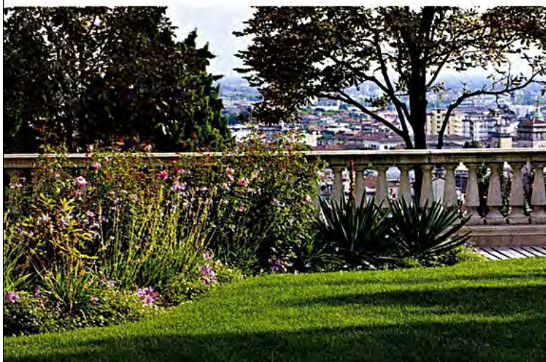
2. Nel giardino inferiore a sud, rose 'John Clare', tulbaghie, Colchicum autumnale e Yucca gloriosa .