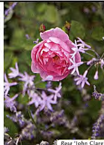
Rosa 'John Clare'

2. Sotto al pergolato d'uva ( Vitis vinifera 'Isabella'), il tavolo per pranzare all'aperto.