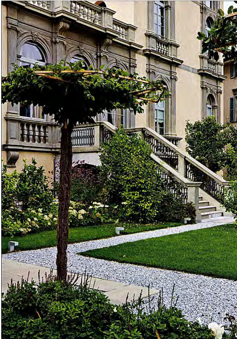
1. Il giardino superiore sul lato sud; si notano Amelanchier canadensis , limoni, Verbena