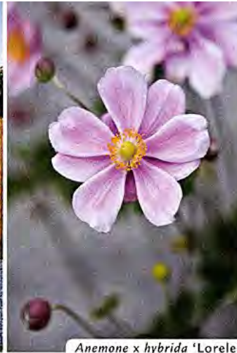
Anemone x hybrida 'Lorelei'